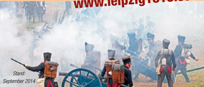
Stand: September 2014